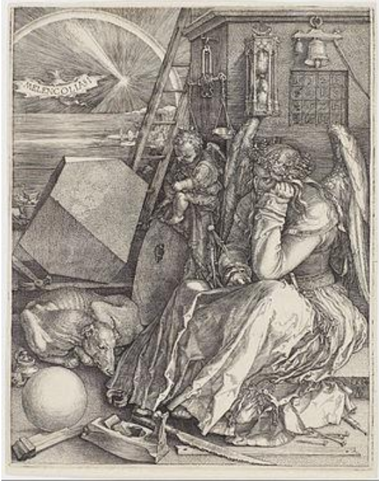
Albrecht Dürer, Melencolia I, 1514.