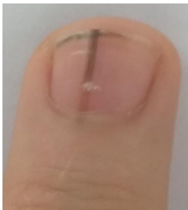
Slika 1. Nevus matriksa nokta