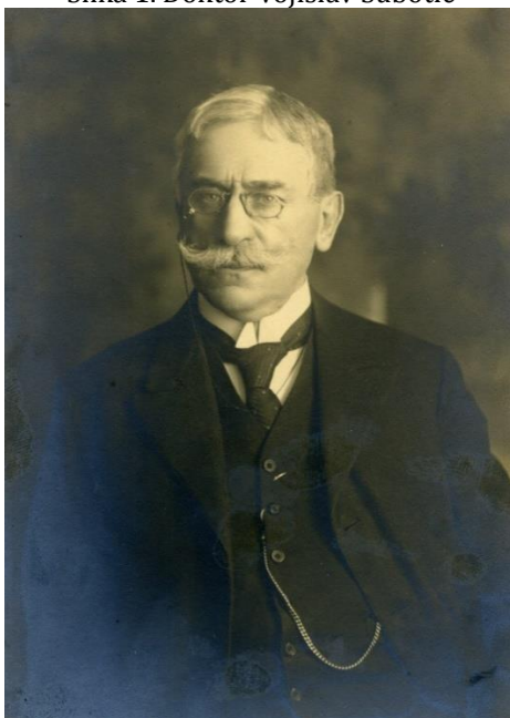
Slika 1. Doktor Vojislav Subotić

Albert je bio poznat po uvođenju antiseptice, novim operativnim zahvatima u hirurgiji kao što su junostomija i nefrektomija, kao i po prvom izvođenju transplantacije živca i mnogim drugim dostignućima. Subotić je takođe učio kod Karela Majdla, koji je uveo kolostomiju u abdominalnu hirurgiju. Nakon sticanja znanja kod ovih velikih hirurga, Subotić je postavljen za fizikusa i primarnog lekara u Zemunu, gde je osnovao Hirurško odeljenje i postao upravnik bolnice. Tu je izvodio složene operacije i objavljivao radove u prestižnim naučnim časopisima u Austrougarskoj i Nemačkoj. Preuzeo je mesto šefa Hirurškog odeljenja Opšte državne bolnice u Beogradu početkom 1889. godine. Odmah je počeo sa velikim poslom na razvoju i izgrađivanju srpske hirurgije. U nekim publikacijama se dodaje i priča o njemu sa rečju "Stariji" kako bi se razlikovao od drugog Vojislava, Vojislava M. Subotića, prvog srpskog neuropsihijatra. Oba gospodina su na različite načine doprineli srpskoj medicini i zaostavili veliki uticaj na društvo. Operacije koje je hirurški Subotić uspešno izvodio u vremenu kada nisu postojali savremeni medicinski tehnološki napretci, kao što su endotrahealna anestezija, parenteralna rehidracija, transfuzija krvi i antibiotici, bile su zaista herojski poduhvati. Danas, mnoge složene operacije koje je on uspešno izvodio, mogu da izvedu samo mali broj hirurga u našoj zemlji, što pokazuje koliko je bio veliki i vešt u svome poslu [1,3,4].