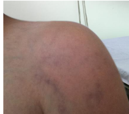
Fig. 1. Left shoulder oedema with a pronounced secondary varices in 62 year old male patient with UEDVT

Pacijent je na odeljenju lečen niskomolekularnim heparinom (LMWH). U sklopu pretrage potencijalnog maligniteta urađeni su: rendgenogram pluća, na kome je uočena stara, sanirana serijska fraktura V-IX rebra desno, plućni parenhim bez vidljivih svežih infiltrativnih zasenjenja; CT grudnog koša, nativno i sa intravenskim kontrastom, na kome je opisana tromboza leve potključne i unutrašnje jugularne vene, bez vidljivih ekspanzivnih promena u projekciji gornje aperture toraksa, niti medijastinalno na načinjenim skenovima; ultrazvučni pregled abdomena i male karlice, kojim je uočena uvećana, prominentna prostata, dimenzija 56mm x 53mm, neravnih-viloznih kontura ka lumenu bešike. Zbog ultrazvučnog nalaza i vrednosti PSA, transperinealno urađena biopsija prostate i uzeto 5 isečaka. Patohistološki verifikovan invazivni adenokarcinom prostate (Gleason score: primarni grade 3, sekundarni grade 3, zbir 6). Pacijent je potom upućen na onkološki konzilijum.