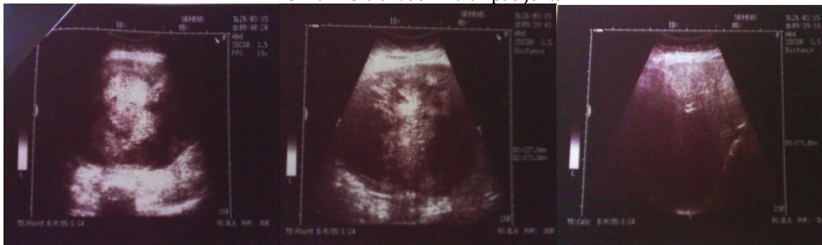
Slika 1. Ultrazvučni nalaz pacijenta.

Ultrazvučnim pregledom nije bilo moguće difrencirati poreklo tumora, pa je pacijentkinja poslata na CT abdomena gde je potvrđeno da se u ventralnom delu truha, od