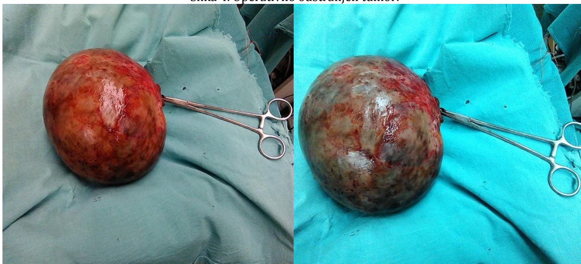
Slika 4. Operativno odstranjen tumor.

Pacijentkinja je operisana u opštoj endotrahealnoj anesteziji, gde se eksploracijom trbuha konstatuje da je tumorska promena ovarijalnog porekla. Ex tempore patohistološki nalaz ukazuje na benignu promenu. Ovarijum sa pripadajućim tumorom odstranjen je u celosti (slika 4).