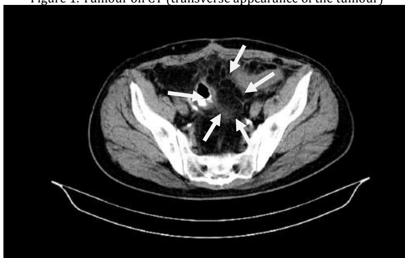
Slika 1. Prikaz tumora na CT-u (transverzalni izgled tumora). Figure 1. Tumour on CT (transverse appearance of the tumour)

Pacijent je upućen na onkološki konzilijum Instituta za onkologiju Vojvodine u Sremskoj Kamenici koji je indikovao monohemioterapiju sa doksorubicinom u dozi od 75mg/m 2 , u vidu 4 ciklusa sa, razamakom od 3 nedelje između ciklusa, a nakon pregleda kardiologa i ehokardiografije. Zaključak ehokardiografije: Dijastolna disfunkcija leve komore; EF procenjena na oko 65%. Nakon isprimane hemioterapije, urađeni MRI