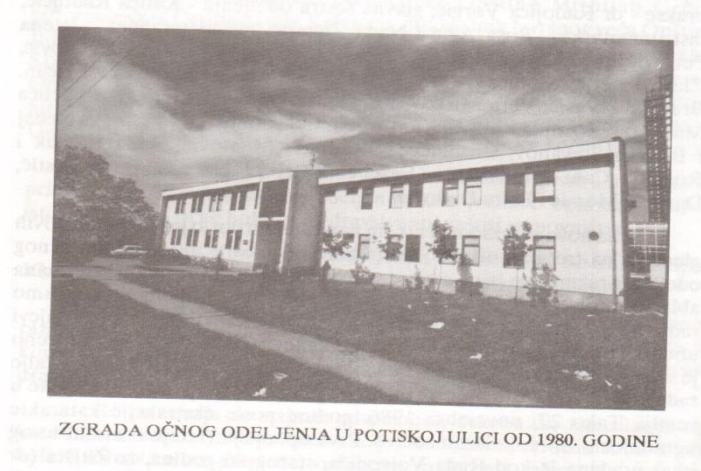
ZGRADA OČNOG ODELJENJA U POTISKOJ ULICI OD 1980. GODINE