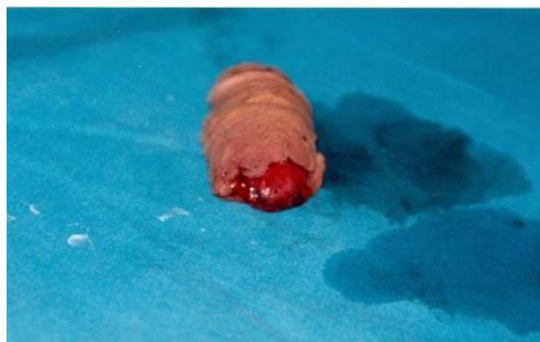
Slika 1. Kompletna amputacija

Penis je organ koji je anatomske podeljen na tri dela: koren, telo i glavić penisa. Koren se nalazi