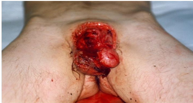
Slika 2. Amputacija penisa i otvorena povreda skrotuma.