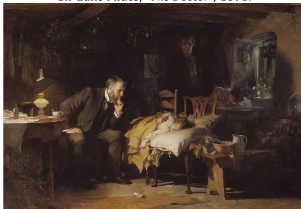
Luke Fildes, Doktor , 1891. Sir Luke Fildes, "The Doctor", 1891.

Ser Henri Tejt je 1890. godine od umetnika Luke Fildsa naručio sliku po njegovom nahođenju. Umetnik je pri stvaranju ovog dela imao na umu tragičan događaj iz sopstvenog života – smrt svoga sina u uzrastu od godinu dana. Bez obzira na tragediju, Fildes je bio impresioniran predanošću i zalaganjem doktora koga je tada imao prilike da gleda očima oca bolesnog deteta. Ali slika o kojoj je reč prikazuje „doktora tog vremena“, kroz lik doktora prikazuje samu suštinu lekarske profesije, a ne neku konkretnu ličnost [8].