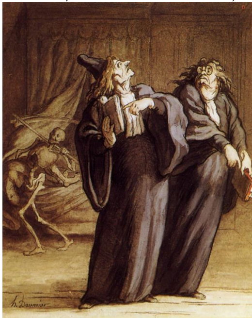
Onore Domije, Dva doktora i smrt , 1869. Honoré Daumier, Les Deux medecines et la Mort , c. 1869.

Onore Domije, koga su nazivali „Mikelandelo karikature,” bio je slikar, štampar, skulptor i karikaturista. Tokom svog radnog veka načinio je više od 4000 litografija koje su poznate po specifičnoj satiri u kojima su glavni likovi bili političari. U svojim karikaturama naglašavao je političku situaciju svog vremena, oslikavajući korupciju u sudstvu, greške birokratije i nekompetentnost vlade. Zbog oštrog pera bio je i u zatvoru.